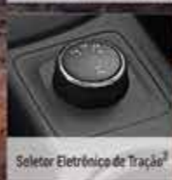
Seletor Eletrônico de Tração

180 cv com 47,9 kgfm de torque 1.039 kg de capacidade de carga 1 Controle Eletrônico de Tração e Estabilidade 1 www.novachevroletS10.com.br