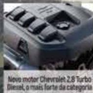
Novo motor Chevrolet 2.8 Turbo Diesel, o mais forte da categoria