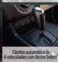
Câmbio automático de 6 velocidades com Active Select