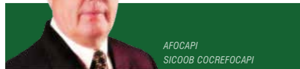
AFOCAPI SICOOB COCREFOCAPI